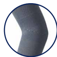
Zone de confort bras