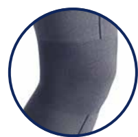
Zone de confort genou