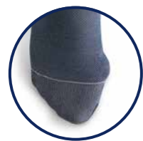
Hallux valgus orteil fermé