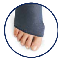
Hallux valgus orteil ouvert