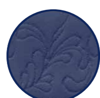
Ceinture à motif floral (5 cm)