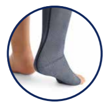
Zone de confort cheville